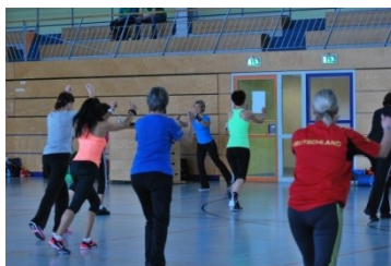
Fitness und Aerobic