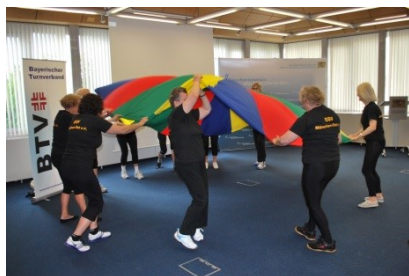
Sport mit Älteren

Die Inhalte der Ausbildung bieten einen Einblick in das vielfältige Angebot des Bayerischen Turnverbandes.